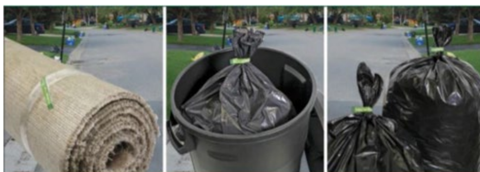
Figure 1 : Étiquettes apposées sur différents sacs à ordures ou sur différents articles à jeter

Les avantages d'un programme de péage d'une partie des frais de dépôt des déchets