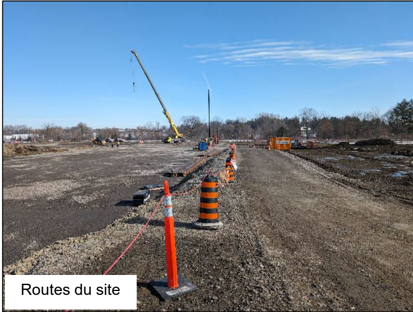
Routes du site