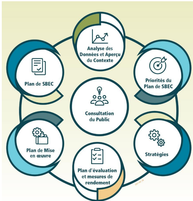
Figure 1: Approche d'élaboration

Dans le cadre du rapport de la Feuille de route, le Conseil a approuvé huit principes directeurs pour orienter l'élaboration du Plan de sécurité et de bien-être dans les collectivités. Les principes directeurs sont les suivants et sont définis plus en détail dans le Document 1 :